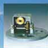
ΓΡΑΝΑΖΙΑ ΤΑΛΑΝΤΩΣΗΣ Υψηλής ποιότητας κατασκευή για ομαλή και ανοδική λειτουργία Κύριοι γραναζιών από αλουμίνιο