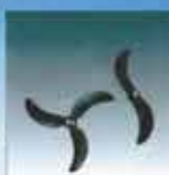
ΦΤΕΡΑ Κατασκευασμένα από ντυραλομμένο υψηλής ποιότητας με ηλεκτροστατική βαφή Εργονομική σχεδίαση