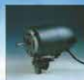
ΜΟΤΕΡ Μεγάλη αντοχή και υψηλή απόδοση Μοτέρ τριών ταχυτήτων