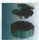
ΜΗΧΑΝΙΣΜΟΣ ΠΡΟΣΤΑΣΙΑΣ ΤΩΝ ΓΡΑΝΑΖΙΩΝ ΤΑΛΑΝΤΩΣΗΣ Προστασία από τη σκόνη και την καταστροφή σε περίπτωση τυχαίων μπελομαζών στο περιβάλλοντα χώρο