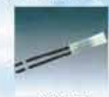
ΑΣΦΑΛΕΙΑ ΠΡΟΣΤΑΣΙΑΣ ΑΠΟ ΤΗΝ ΥΠΕΡΘΕΡΜΑΝΣΗ Υψηλής ποιότητας θερμική προστασία του μοτέρ από την υπερθέρμανση, έως 135°C